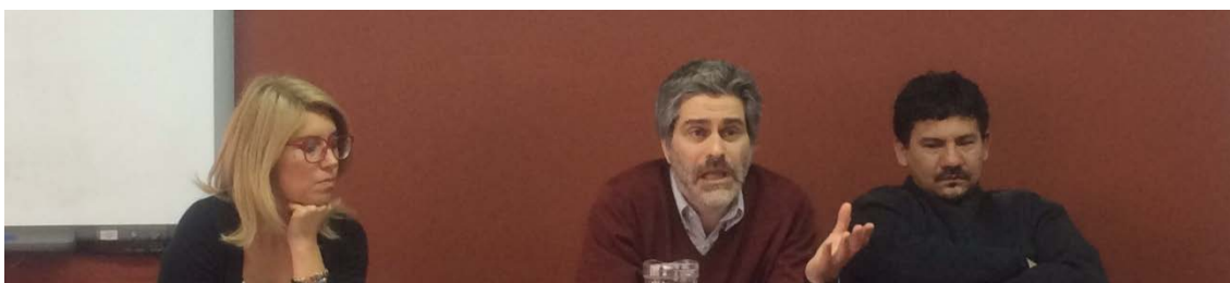
Celebración del Día del Politólogo en el Senado de la Nación, 1 de diciembre de 2015.