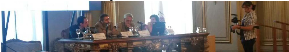
Charla para incentivar la concurrencia de estudiantes al XII Congreso, Universidad de San Andrés, 13 de abril de 2015.