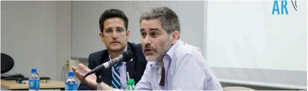
I Jornada Internacional sobre Innovaciones Democráticas organizadas por la Dirección de Reforma Política del Gobierno de la Ciudad de Buenos Aires, en colaboración con la Universidad Austral y la Embajada de Canadá, realizada en la Legislatura de la CABA, 13 de marzo de 2015.